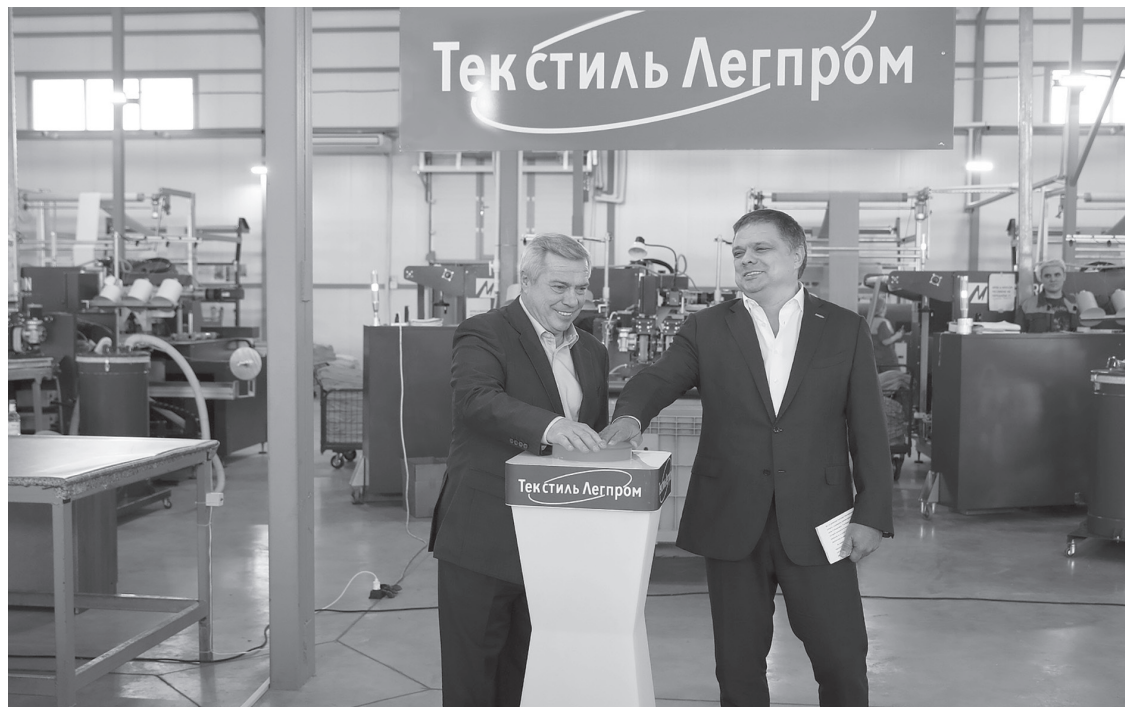
Открытие новых предприятий – большой вклад в развитие экономики всего региона