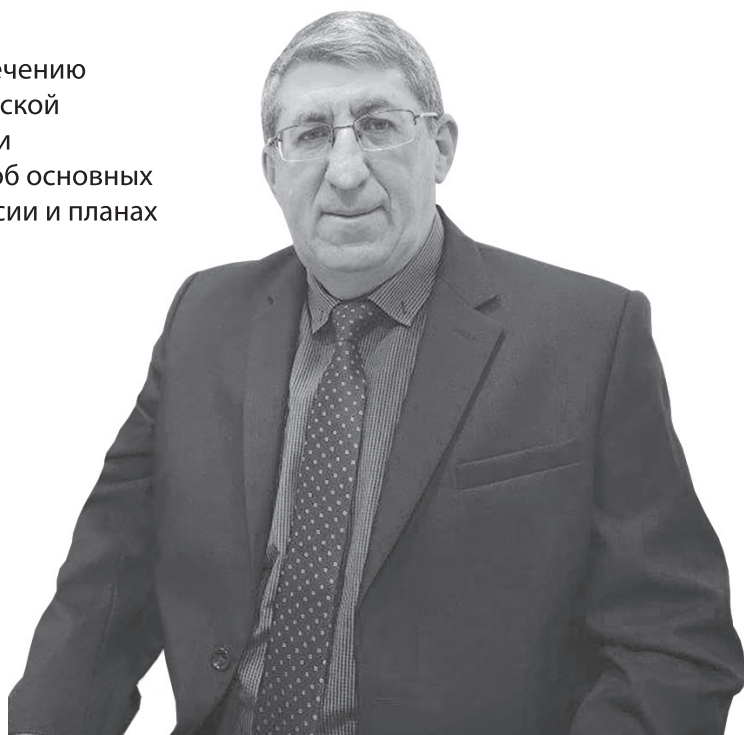
Александр Бужак считает, что наркоситуация в регионе в целом стабильная, но проблема наркомании требует повышенного внимания

– Да, но работать еще есть над чем. В 2022 году было выявлено более 5,7 тысячи преступлений, связанных с незаконным оборотом наркотиков, изъято более 193 кг наркотиков, пресечено почти 3,7 тысячи административных