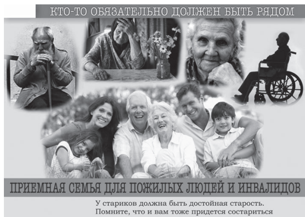
У стариков должна быть достойная старость. Помните, что и вам тоже придется состариться

За 2022 год данной услугой воспользовалась 1061 семья на сумму 7340,5 тыс. руб.