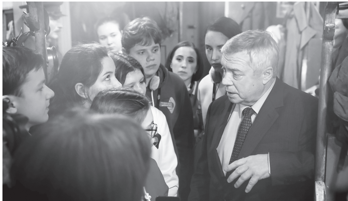
О подвигах поколения победителей с молодыми нужно говорить чаще, говорить честно, считает губернатор

Сохранить память о Великой Отечественной позволяет и уникальная передвижная выставка-музей «Поезд Победы». Состав из десяти вагонов побывал в