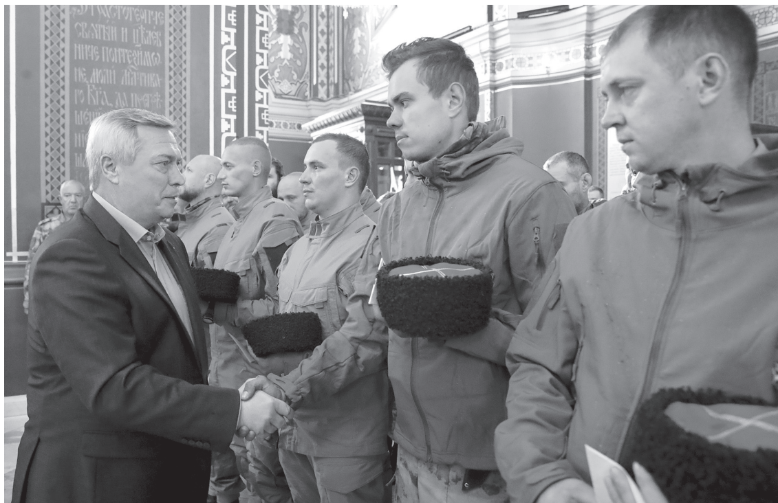
И сегодня на Дону воспитывают новые поколения казаков, любящих Отечество и служащих ему

– Выставки, фестивали, соревнования, викторины, лекции – вот основные виды мероприятий, посвященных Году атамана Платова, – отметил губернатор. – От организаторов каждого из них требуется, чтобы это были настоящие события – интересные, живые и одинаково привлекательные и для молодежи, и для старшего поколения.