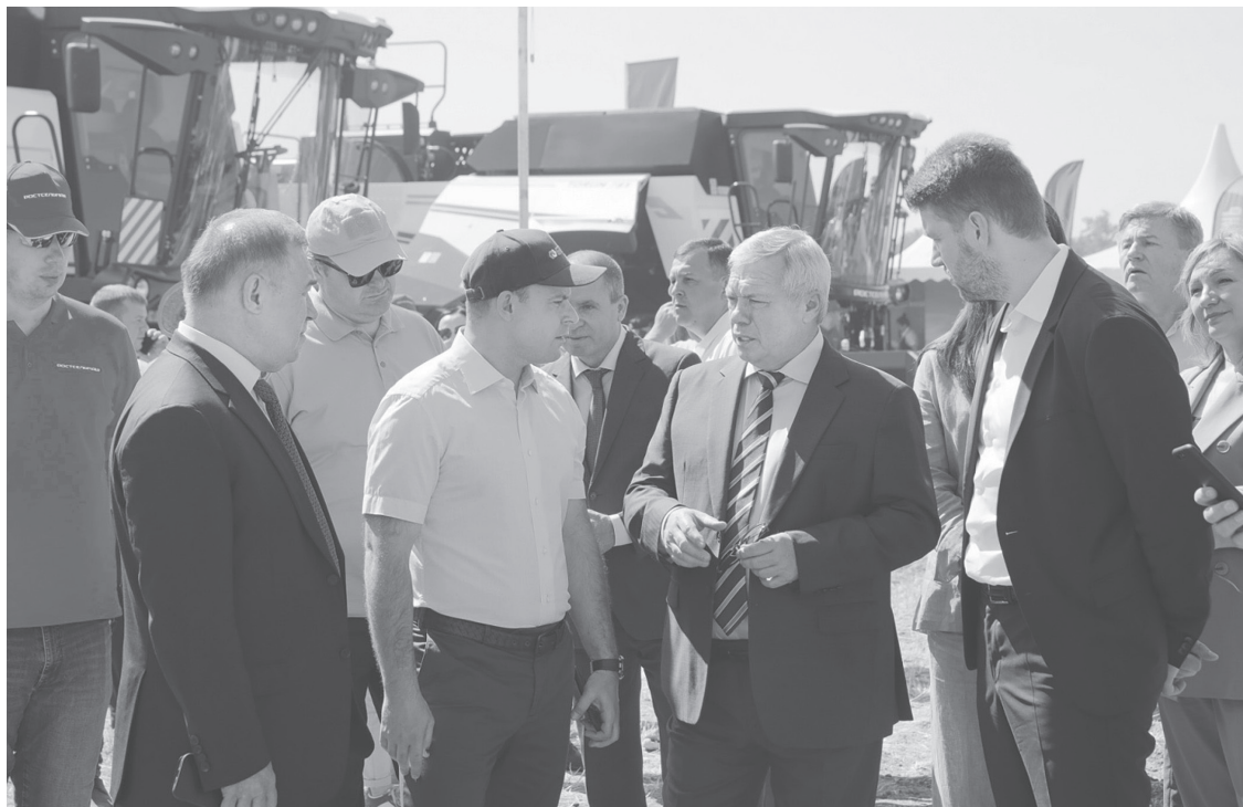
Ростовская область практически готова начать битву за урожай-2023

Самый большой парк сельхозтехники в стране сегодня, как из-