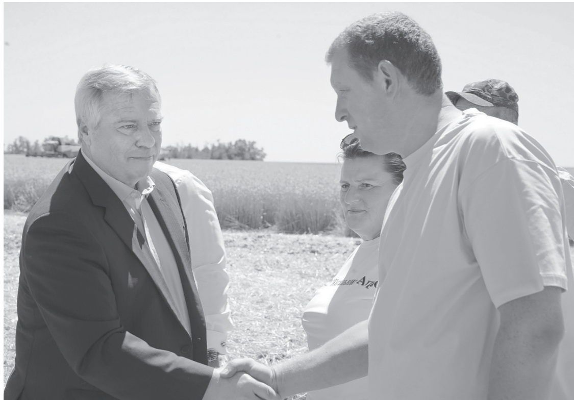
Для донских аграриев настала самая горячая и ответственная пора

Техническая готовность – важнейшая составляющая своевременной и эффективной уборки урожая, именно поэтому правительство области уделяет большое внимание вопросам модернизации парка сельхозмашин. За последние пять лет в регионе приобретено 2,4 тысячи зерноуборочных комбайнов, что позволило на 6% снизить нагрузку на каждую машину. В этом году на субсидии для приобретения новой сельхозтехники из областного бюджета