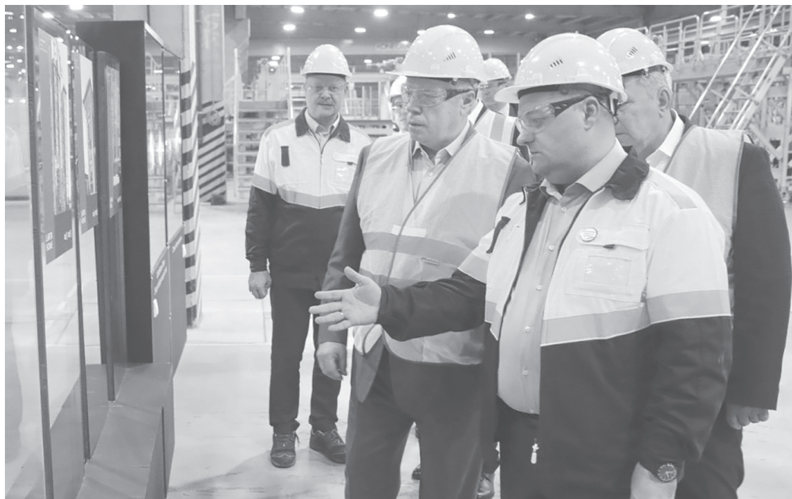
Продукция донских предприятий востребована и в других регионах, и в дружественных странах

эксплуатацию новый комплекс по выпуску субстратов из каменной ваты для тепличных хозяйств. Материалы займут 15% российского рынка. Стоимость проекта составила почти полмиллиарда рублей, выполнен он был в сжатые сроки.