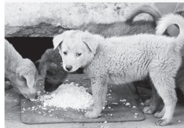
ВОЗМОЖНО ИМЕННО ВАША ПОМОЩЬ ПОМОЖЕТ ПЕРЕЖИТЬ ИМ ЭТУ ЗИМУ...

Данная Акция направлена на формирование милосердия и сострадания у подрастающего поколения, посредством вовлечения их в добровольческую деятельность по оказанию помощи приюту для бездомных животных в рамках акции «Варежка Добра».