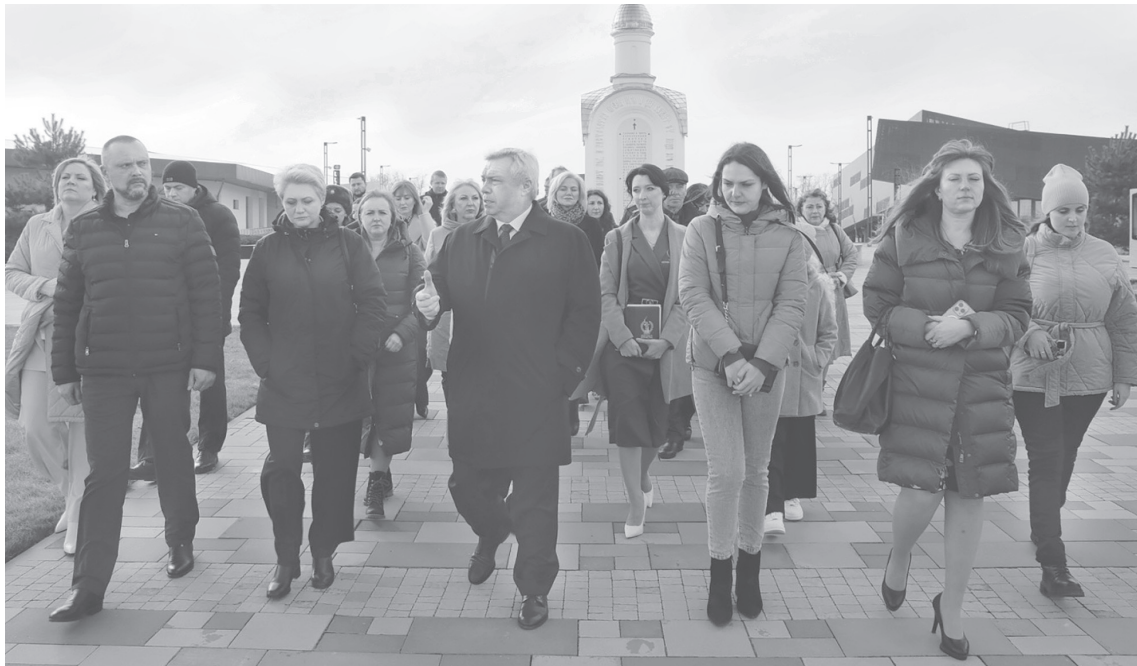
Василий Голубев с семьями участников СВО почтили память всех воинов, отдавших жизнь за Отечество

– Президент поручил на всех уровнях принимать дополнительные меры по увековечиванию памяти наших сегодняшних героев, – сказал Василий Голубев. – И мы понимаем, что эта работа для нас – навсегда.