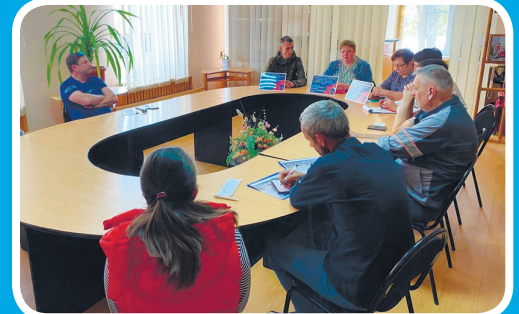
В Матвеево-Кургане прошла Всероссийская ярмарка трудоустройства. Стр. 8.