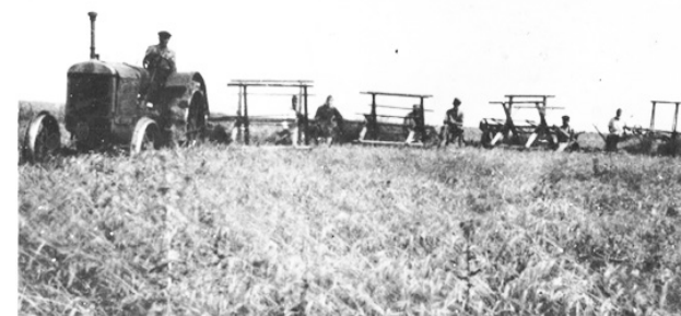
Колесный трактор "Универсал". на колхозном поле