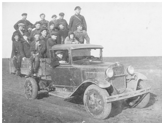
Рабочие М-Курганской машинотракторной станции (МТС) 1937г.

Должности могли называться по-разному – первый секретарь РК КПСС, председатель районного Совета депутатов трудящихся, глава Администрации района, но смысл деятельности от этого не менялся – ты отвечаешь за все, что происходит в районе.