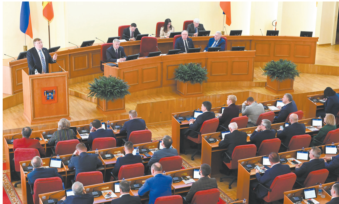
Шестое заседание Законодательного Собрания области было посвящено принятию самых актуальных решений

В два раза была увеличена и ежемесячная денежная выплата на каждого ребенка в многодетной семье. Сейчас ее размер – 521 рубль, после повышения она составит