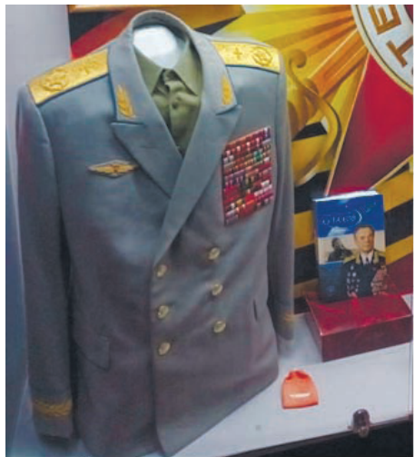
ПАРАДНЫЙ КИТЕЛЬ П.С.КУТАХОВА В ЭКСПОЗИЦИИ РКМ

обороне Мурманска, Кандалакши и Кировской железной дороги. В апреле 1942 года полк был преобразован в 19-й гвардейский истребительный авиационный полк. В апреле 1943 года получил должность помощника командира полка по воздушно-стрелковой службе.