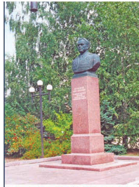
БРОНЗОВЫЙ БЮСТ ГЕРОЯ В РОДНОМ СЕЛЕ