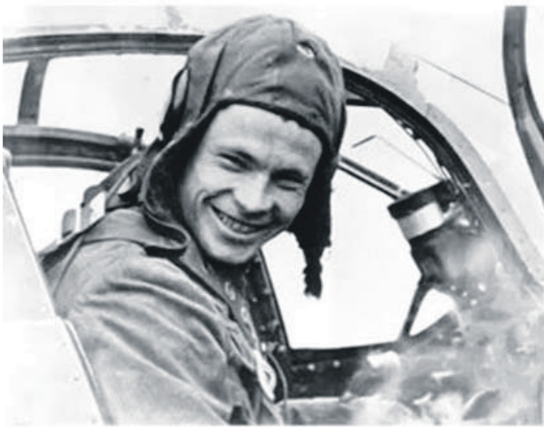
ЗА ШТУРВАЛОМ БОЕВОЙ МАШИНЫ